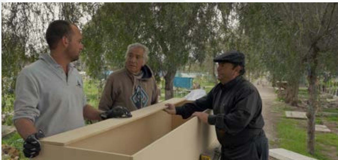
Fotografía: El patio (2016)

3. Finalmente, proponemos profundizar, por medio de una investigación, sobre la persistencia de la práctica de la desaparición forzada de personas por parte de los Estados, catalogado como crimen de lesa humanidad por la OEA y la ONU, crimen que no prescribe. Más de 6.700 muertes o desapariciones de personas migrantes ha registrado el proyecto Migrantes Desaparecidos, de la Organización Internacional para las Migraciones (OIM) en Centroamérica, Norteamérica y el Caribe, desde 2014. En las décadas de los 70 y 80, América Latina sufrió los mayores casos de desaparición de personas, principalmente por parte de las dictaduras militares. Lejos de solucionarse, el problema continúa hasta nuestros días con cifras realmente preocupantes. Especialmente en países como México, Perú, Colombia, Guatemala, El Salvador, con Colombia y México liderando la estadística. Para profundizar sobre ello sugerimos centrarse en un caso chileno o latinoamericano para conocer: cómo ocurrió la desaparición, cuál ha sido el rol de las familias, de las instituciones encargadas de resguardar los derechos humanos y aplicar el Estado Derecho, y de las instituciones involucradas en las desapariciones de estas personas y comunicar lo investigado organizando una mesa redonda donde se comparta y dialogue sobre las causas y consecuencias que se derivan de este crimen de lesa humanidad y cómo debemos profundizar los sistemas democráticos para que esto no siga ocurriendo.