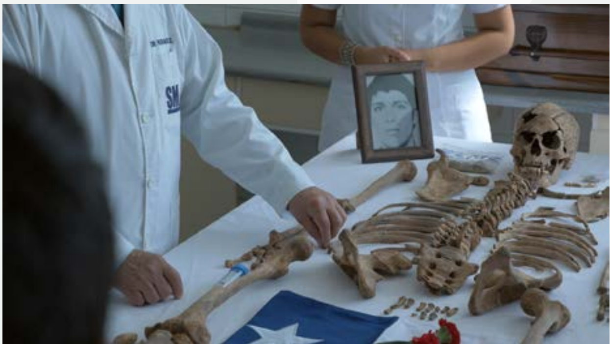
Fotografía: El patio (2016)

https://www.ohchr.org/es/instruments-mechanisms/instruments/international-convention-protection-all-persons-enforced#:~:text=1.,justificación%20de%20la%20desaparición%20forzada