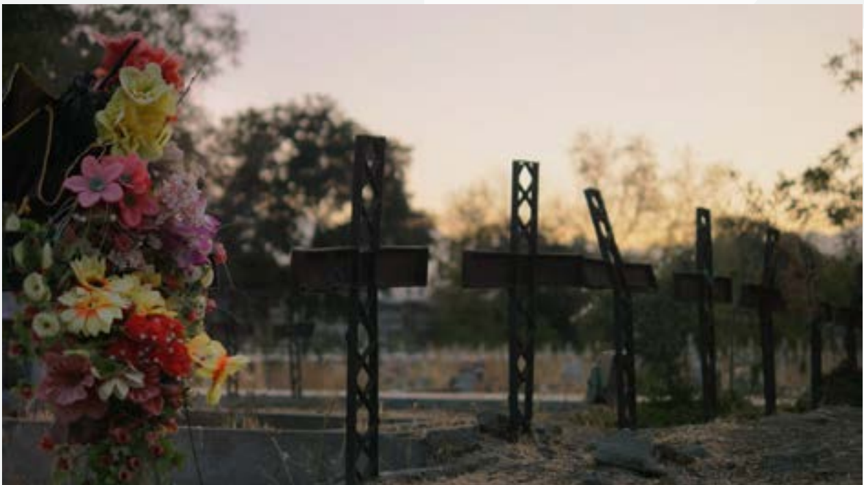
Fotografía: El patio (2016)