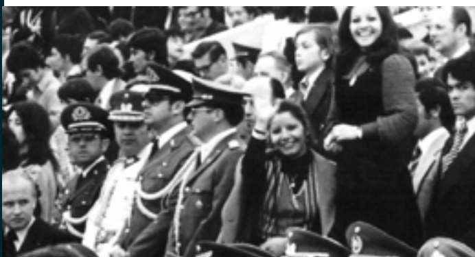
Fotografía: El pacto de Adriana (2017)

Esta labor, responde también al objetivo de educar en derechos humanos y en democracia, aportando a la promoción y comprensión de una convivencia centrada en el respeto y la práctica de estos derechos.