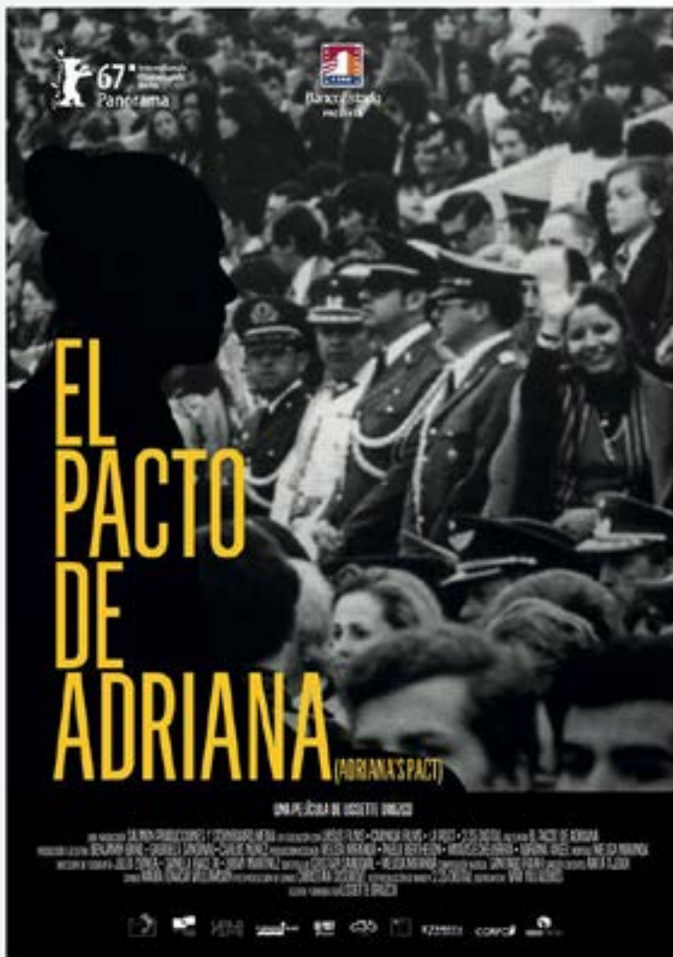
Fotografía: El pacto de Adriana (2017)

Liss vive una desilusión que la lleva a exponerse en esta obra con el fin de aportar a la reflexión y el diálogo de las nuevas generaciones.