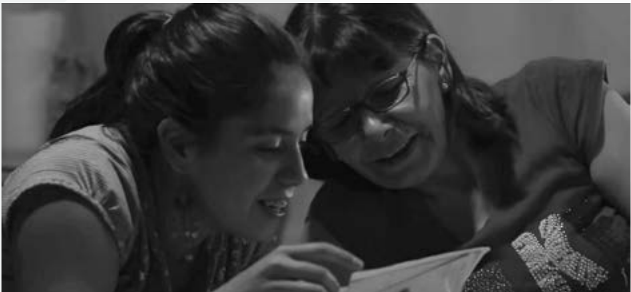
Fotografía: El pacto de Adriana (2017)