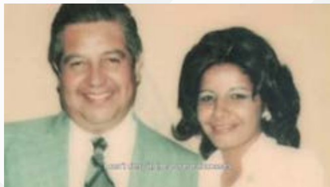
Fotografías: El pacto de Adriana (2017)