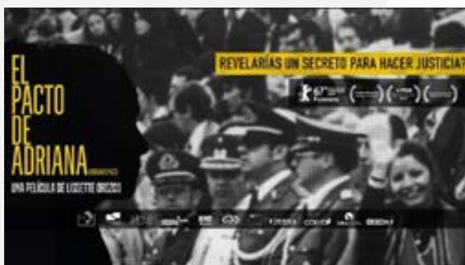
Fotografía: El pacto de Adriana (2017)

Para ello, se propone indagar en las percepciones de cada integrante del grupo, considerando sus saberes previos, reflexiones, aprendizajes y conclusiones sobre el tema central del documental, que les permita valorar la necesidad de justicia a 50 años del golpe de Estado de 1973.