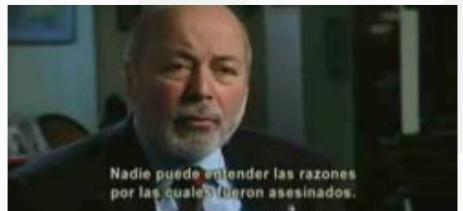
Fotografías: El Juez y el General (2008)