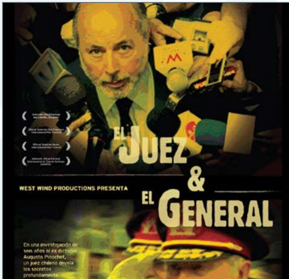
Fotografía: El Juez y el General (2008)