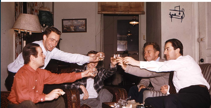
Fotografía: Chicago Boys (2015)

Esta labor, responde también al objetivo de educar en derechos humanos y en democracia, aportando a la promoción y comprensión de una convivencia centrada en el respeto y la práctica de estos derechos.