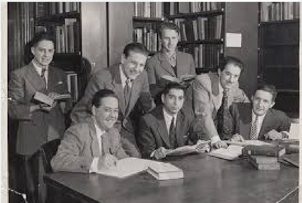
Fotografía: Chicago Boys (2015)

Sinopsis: La dictadura produjo grandes cambios en el país. Uno de ellos tiene relación con la profunda transformación económica. Con mucho material de archivo y entrevistas, Chicago Boys reconstruye la historia de un grupo de economistas chilenos que se formaron con Milton Friedman, exponiendo las ideas sostenidas por el grupo en el pasado y en el presente, así como los efectos de su implementación en el Chile de hoy.