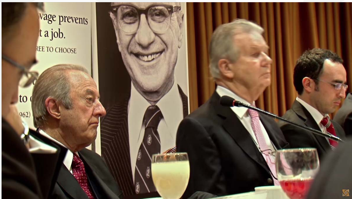
Fotografía: Chicago Boys (2015)