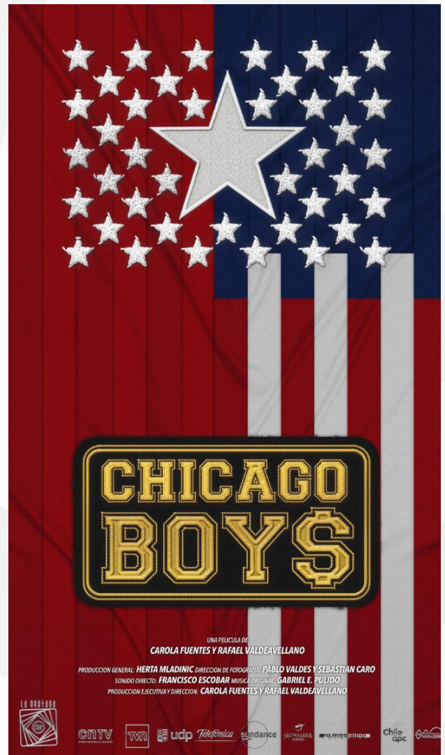
Fotografías: Chicago Boys (2015)